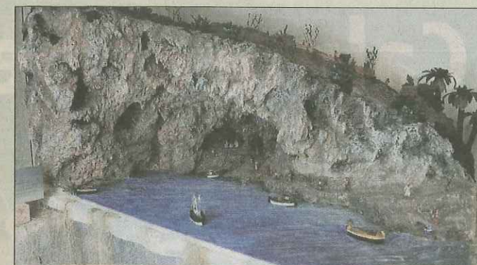
La crèche de Zinzulusa a demandé 250 heures de travail (voir encadré).