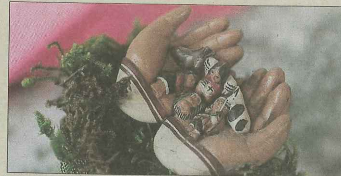
La famille au creux des mains. Exemple de crèche miniature.