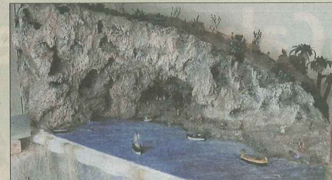
La crèche de Zinzulusa a demandé 250 heures de travail (voir encadré).

► Plus de 180 crèches seront présentées dès aujourd'hui et jusqu'au 6 janvier dans les locaux du Forum de l'Arc, à Moutier.