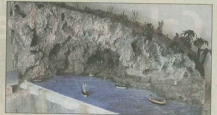
La crèche de Zinzulusa a demandé 250 heures de travail (voir encadré).

► Plus de 180 crèches seront présentées dès aujourd'hui et jusqu'au 6 janvier dans les locaux du Forum de l'Arc, à Moutier.