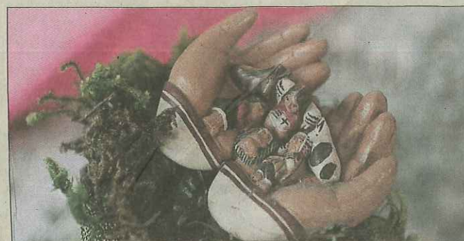
La famille au creux des mains. Exemple de crèche miniature.