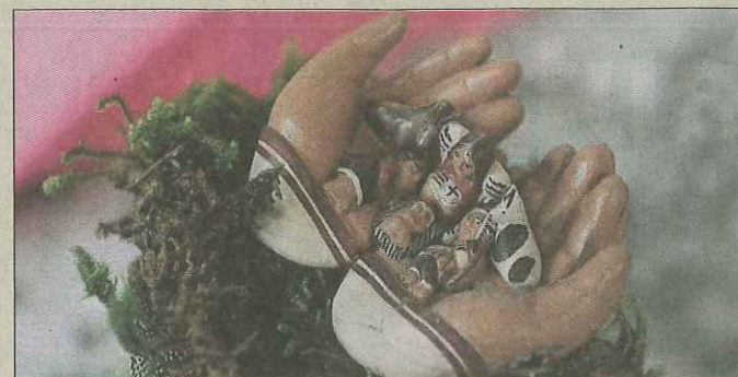
La famille au creux des mains. Exemple de crèche miniature.