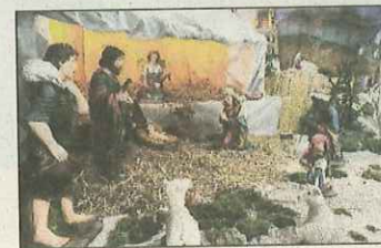
L'exposition a drainé un large public.